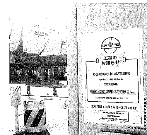
事前に張り紙や看板で利用休止を知らせ

植栽したアンネのバラ 両駐車場は、市の指 定管理を受けて京都市 18日まで。 福知山市のJ.R福知 山駅北口、南口西広場 駐車場が、14日から駐 車場機器の更新工事で 利用を休止している。